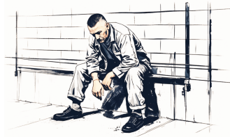
Prisão Preventiva na leimaria dapenha

O artigo vinte prevê a possibilidade de decretação de prisão preventiva do agressor em qualquer fase do inquérito ou da instrução criminal, de ofício pelo juiz, a requerimento do Ministério Público ou mediante representação da autoridade policial.